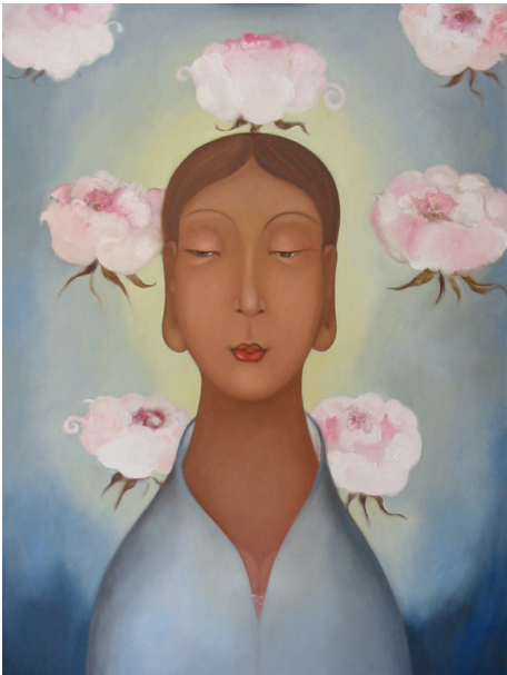
Seven Sainly Blossoms Huile sur toile 130x97cm 2005